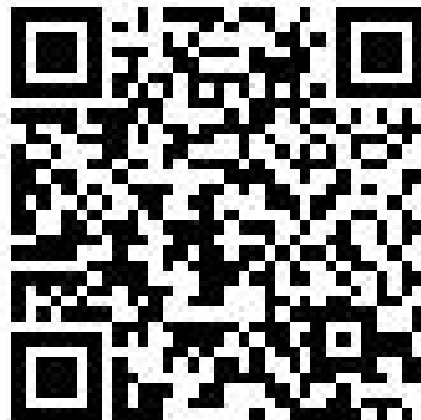
倉吉校インスタグラム